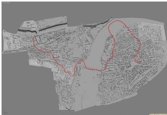
Trajektorie (pohybová křivka) kamery městem Prahy

Pro usnadnění obsluhy systému je jeho ovládání automatizované. Obsluha systém spouští, přepíná a vypíná jen pomocí několika tlačítek. Systém automatického řízení umožňuje naučit ovládání stereokina prakticky každého pověřeného pracovníka.